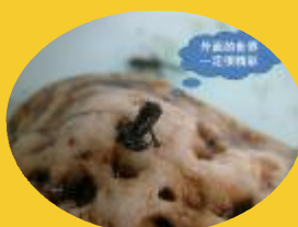
Teddy对外面的世界充满了好奇