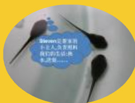
它经常与另外两只蝌蚪在一起游玩