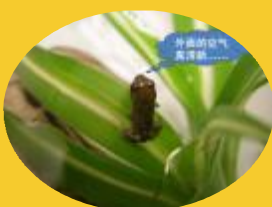
Teddy可以长时间离开水面了